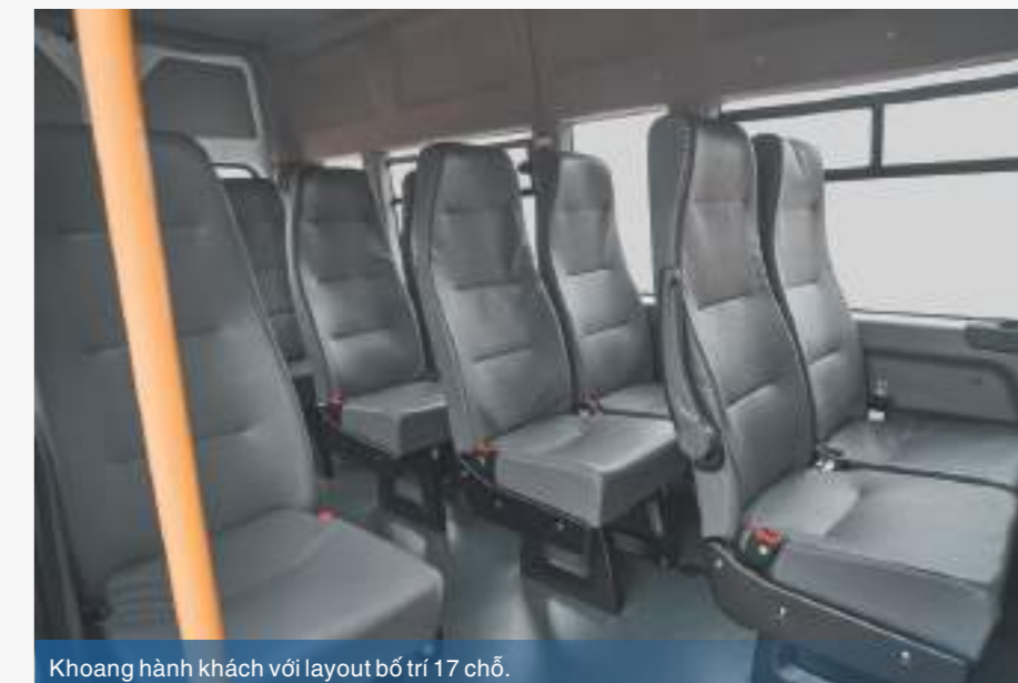
Khoang hành khách với layout bố trí 17 chỗ.