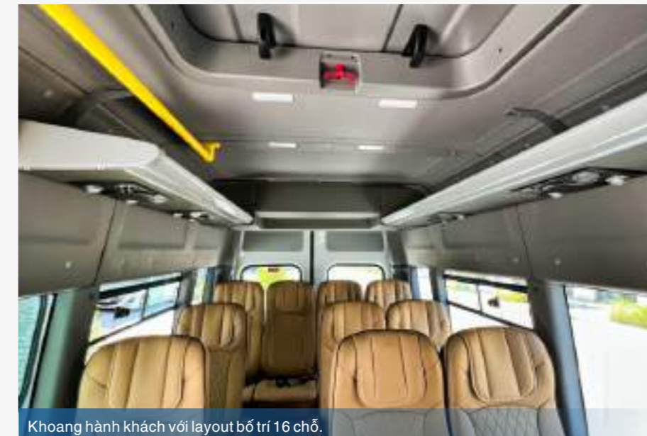
Khoang hành khách với layout bố trí 16 chỗ.

Sàn xe được trải bằng simili chống mòn, chống trơn trượt.