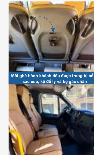
Mỗi ghế hành khách đều được trang bị cổng sạc usb, kệ để ly và bộ gác chân