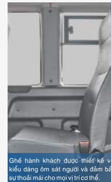
Ghế hành khách được thiết kế với kiểu dáng ôm sát người và đảm bảo sự thoải mái cho mọi vị trí cơ thể.